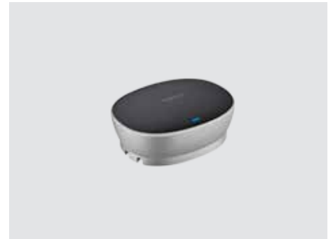
ANSCHLUSSMÖGLICHKEITEN UND VERWENDUNG

Erweitern Sie den Gesprächsbereich von 6 m (20 Fuß) auf 8,5 m (28 Fuß), damit auch die von der Freisprecheinrichtung weiter entfernten Personen deutlich gehört werden. Mikrofone (paarweise verfügbar) werden automatisch erkannt und konfiguriert, indem Sie sie einfach an die Freisprecheinrichtung anschließen.